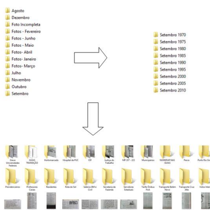
Figura 2: Pastas das notícias

Como referido anteriormente, para caracterizar o T 1 , foi realizada a coleta de notícias a partir do banco de dados da pesquisa desenvolvida pelo GPACE. A alimentação do banco de dados se faz a partir de notícias sobre todas as manifestações públicas de demandas coletivas que ocorreram em determinado mês em todos os anos da pesquisa 4 (por exemplo, todos os casos ocorridos no mês janeiro de 1970, de 1975, de 1980, de 1985, etc.; em seguida, todos os casos ocorridos no mês de fevereiro dos referidos anos; e assim sucessivamente). As imagens das notícias ficam armazenadas em pastas segundo o mês, o ano e, então, as imagens (Figura 2). Assim, para ter acesso às notícias dos eventos de protesto sobre transporte, foi isolada a categoria “transporte, trânsito e circulação” da variável “objeto de reivindicação” (Figura 3), a qual foi cruzada com o mês, o ano e o número da foto correspondente no banco (Figura 4). Com esses dados, pode-se voltar direto à imagem da notícia, para, assim, categorizá-la de acordo com os interesses específicos desta pesquisa.