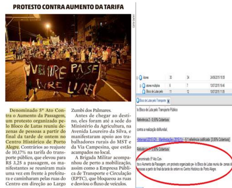
Figura 7: Exemplo de retorno a seleção categorizada (notícia “Protesto contra aumento da tarifa”, 2015)