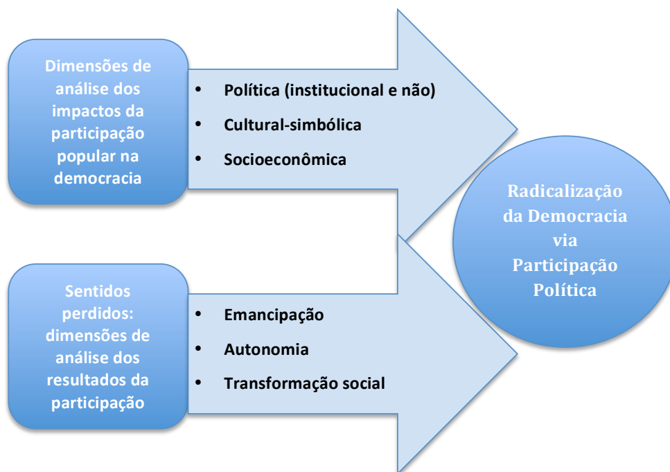
Gráfico - Proposta de modelo teórico-analítico de avaliação da participação

O gráfico abaixo busca resumir esquematicamente a proposta de modelo teórico-analítico de avaliação da participação que busquei construir ao longo deste artigo, com foco na avaliação da militância popular.